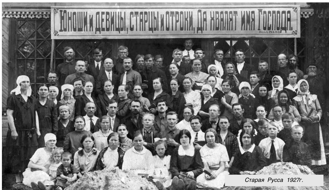
Старая Русса 1927г.

30 июля 1937 года народный комиссар внутренних дел СССР Н.И.Ежов подписал ныне широко известный оперативный приказ № 00447 об опера-