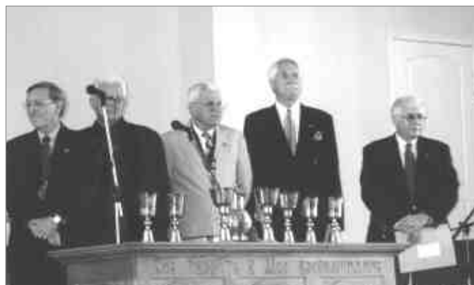
Вынос церковной утвари пред освящением