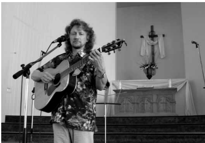
Сергей Шеляговский. Герой книги “Ощути силу перемен” известный певец и композитор.