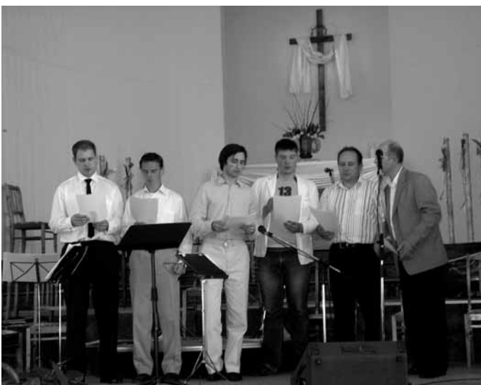
Выступление камерного оркестра "Кредо"

В программе богослужения принимали участие вокальная и инструментальная группы из Санкт-Петербурга, братский вокальный ансамбль и камерный оркестр.