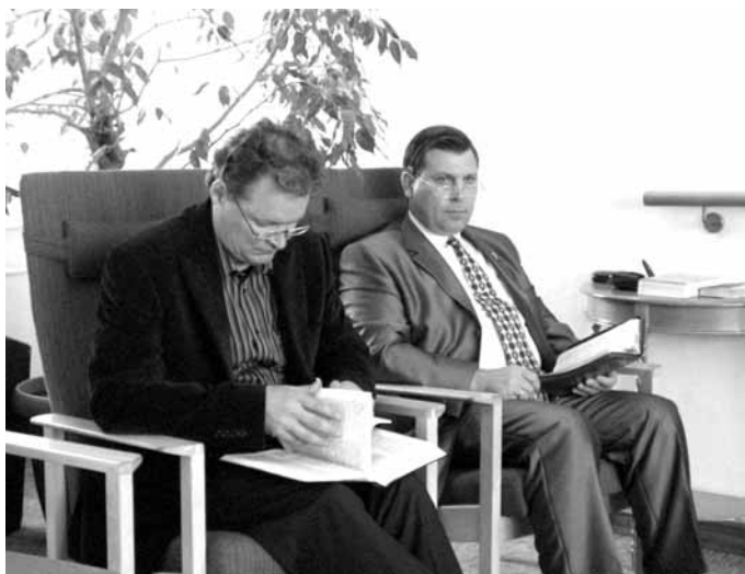
Хану Хаука и Корабель А. И.

27 ИЮНЯ в рамках проекта “Ощути силу перемен” состоялась встреча с героями книги “Ощути силу перемен”. Некоторых участников Новгородцы могли видеть по телевидению. На встрече они рассказывали о своей жизни, о том, каким был их путь к Богу.