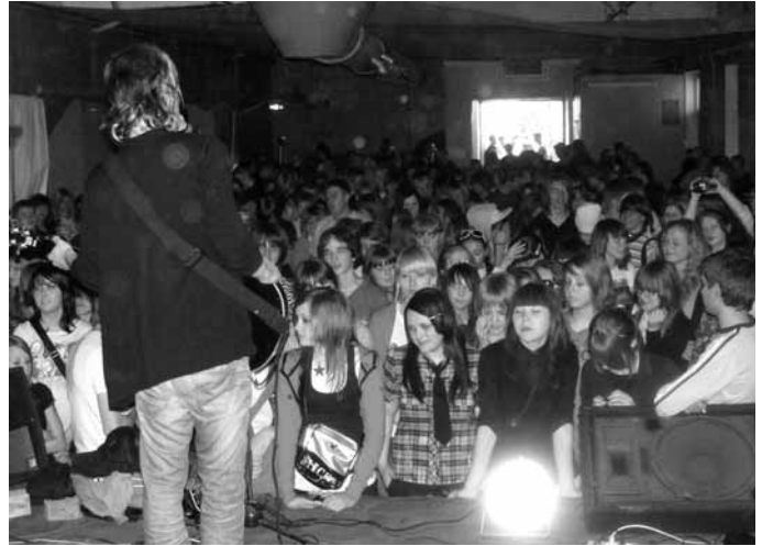
Молодежное кафе в рок-клубе "Паутина"

23 мая в Великом Новгороде в рок-клубе "Паутина", в рамках проекта "Молодежное кафе", существующего под девизом: "Общение, музыка, жизнь", прошел концерт христианской группы СУП*cultura. Цель данного мероприятия - донести благую весть о спасении и Божьей любви к человеку через необычную музыку.