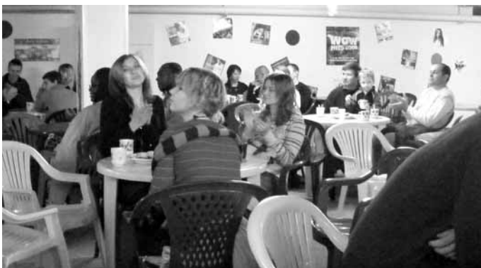
Молодежное кафе в стиле Хип-Хоп

При завершении общения гости услышали краткую весть о спасении, и желающие совершили молитву покаяния. Также каждый желающий получил в подарок красочный молодежный журнал "Книга жизни", в котором ясно, доступным, понятным для молодежи языком излагаются простые христианские истины и на примерах жизненных историй других молодых людей, объясняется, как преодолевать жизненные трудности (такие, как развод родителей, предательство друзей и т.д.); как решать повседневные проблемы, находить выход в трудных для подростка жизненных обстоятельствах, как избежать нежелательных знакомств и вредных привычек, вести здоровый образ жизни, а также почему важно духовное здоровье,