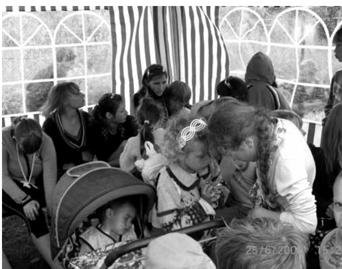
Детская воскресная школа в п. Парфино

С 22 по 25 ИЮНЯ в п. Парфино прошла детская Воскресная школа на канникулах.