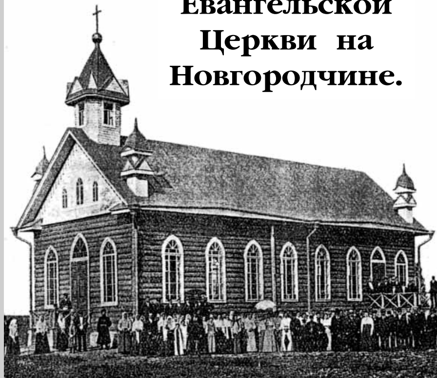
Молитвенный дом д. Ермолино фото 1913 года

140 лет со дня регистрации первой Евангельской Церкви на Новгородчине.