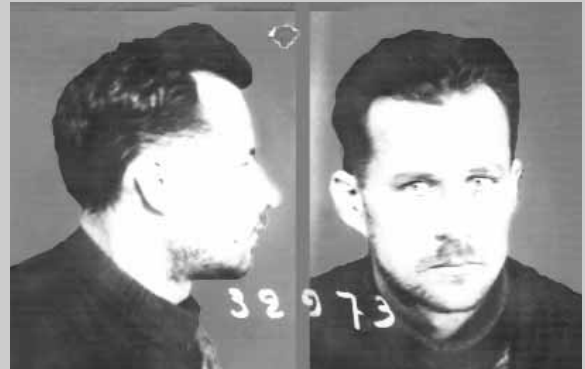
Фердинанд Леппе растрелян 4 сентября 1937 года