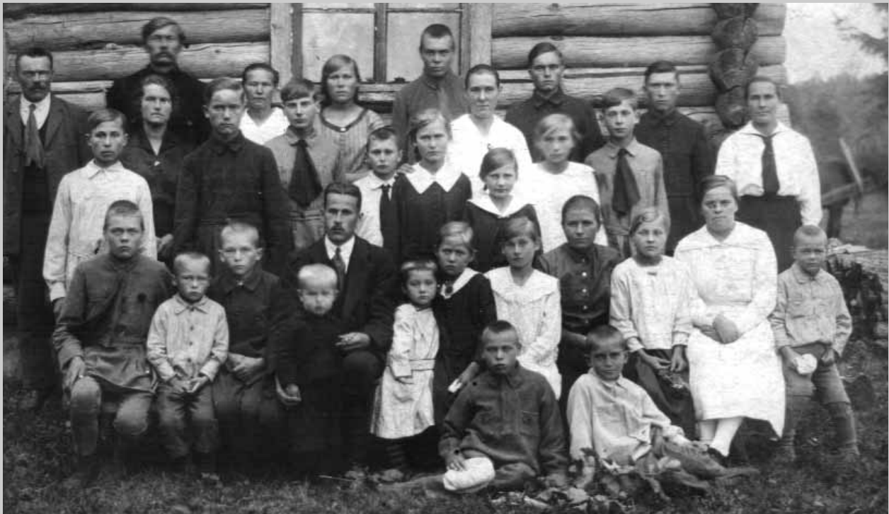
Воскресная школа д. Дубровка, фото 1926 года