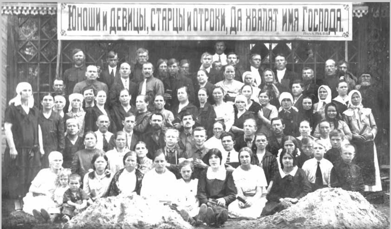
Старорусская община, фото 1927 года