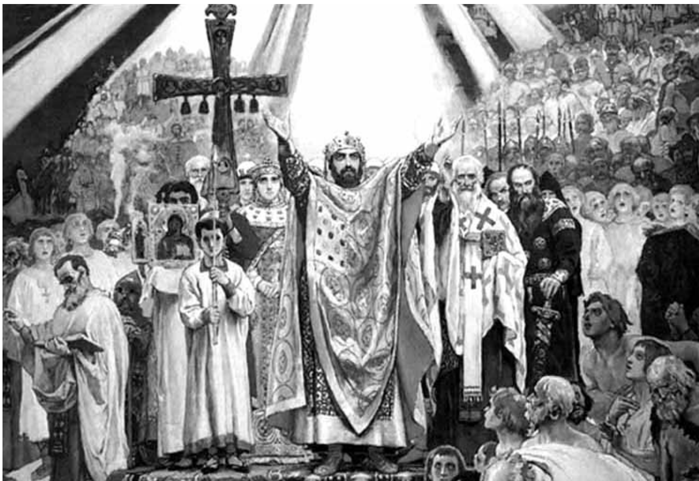
“Крещение Руси,” В. М. Васнецов