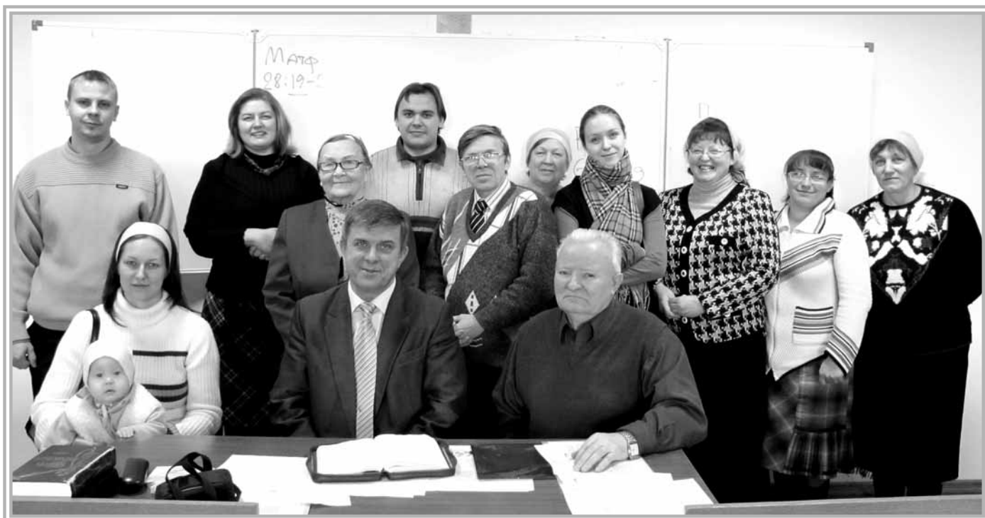
Участники семинара 27 ноября