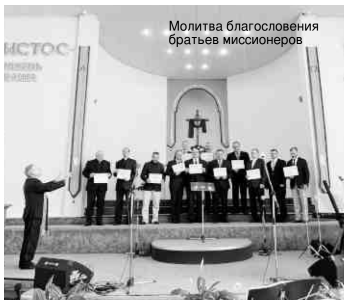
Молитва благословения братьев миссионеров