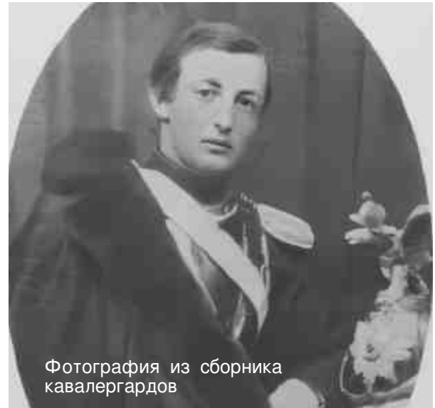
Фотография из сборника кавалергардов