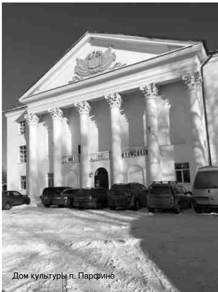
Дом культуры п. Парфино