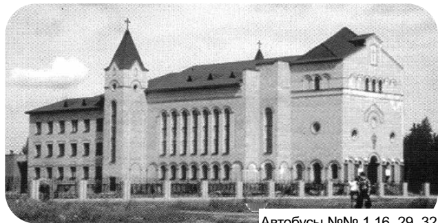
Автобусы №№ 1,16, 29, 32