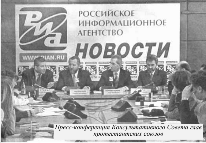
Пресс-конференция Консультативного Совета глав протестантских союзов

На заседании было принято решение переименовать законопроект "О традиционных религиозных организациях в РФ". Было решено дать официальное название документу "О социальном партнерстве и о традиционных религиозных организациях в РФ". Члены рабочей группы предложили снизить временной ценз, необходимый для признания религиозной организации "исторической" и "традиционной", с 95 до 85 лет, а также внести соответствующие изменения в Конституцию и действующий закон "О свободе совести и о религиозных объединениях".