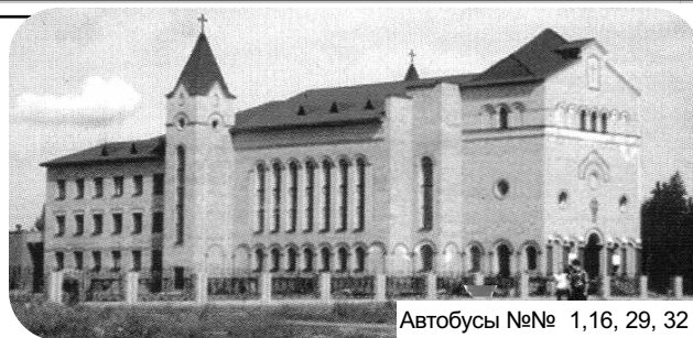
Автобусы №№ 1,16, 29, 32