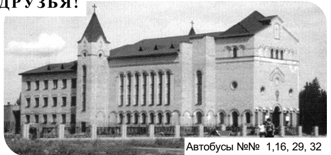
Автобусы №№ 1,16, 29, 32