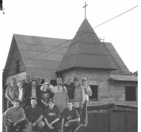
дома в деревнях Зорьке и Зайцево. Дети были рады посетителям, уроку Воскресной школы и подаркам.

Братья и сестры из Америки посетили два детских