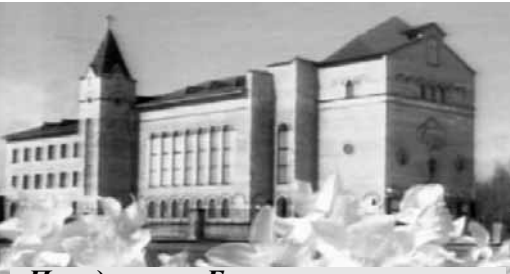
Праздничное Богослужение, посвященное Освящению Храма Христа, 9 июля 2000 года

Я благодарю Бога, что Церкви хватило мужества строить такой Молитвенный Дом. В него не стыдно пригласить Иисуса Христа. У нас в Москве нет такого дома... Будьте кроткими, потому что "кроткие наследуют землю". Пока кроткий Дух Христа присутствует в вашем сердце, вы будете хозяевами этого дома. Будьте чистыми, потому что "чистые сердцем Бога узрят". Пусть будет в ваших сердцах так же чисто, как в вашем Доме!