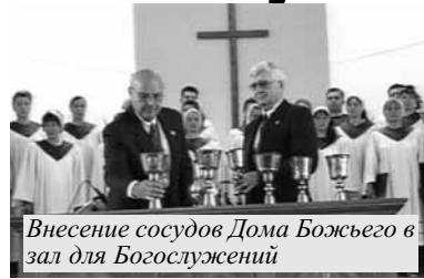
Внесение сосудов Дома Божьего в зал для Богослужений