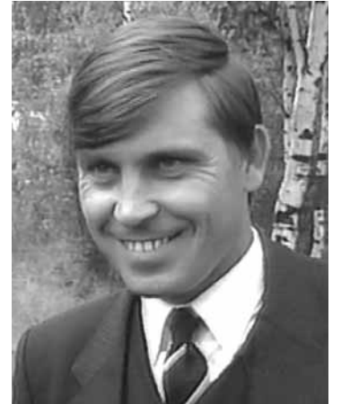
Дорогие мои братья и сестры, друзья!

Много храмов есть в Великом Новгороде и округе, их более 70-ти: есть храмы Апостолов, есть храм Софии - мудрости человеческой, но храма, посвященного Иисусу Христу, до сего дня не было. Слава Богу, Он открывает двери. Пусть Господь благословит, чтобы мы задумались об имени Иисуса Христа.