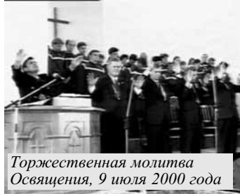
Торжественная молитва Освящения, 9 июля 2000 года

Освятить - отделить человека или вещь для служения Богу. Освящение - обряд, которым люди или вещи посвящаются для святых целей. Так, например, освятились Аарон (брат Мойсея) и сыновья его омовением, одеванием, помазанием елеем. Освящение храма Соломона сопровождалось большими жертвоприношениями от царя и народа (3 Цар. 8:63); также и освящение второго храма (Езд. 6:16). Во Втор. 20:5 говорится об освящении жилых домов; в Неем. 12:27 - об освящении Иерусалимской стены и т.д. Библейский словарь