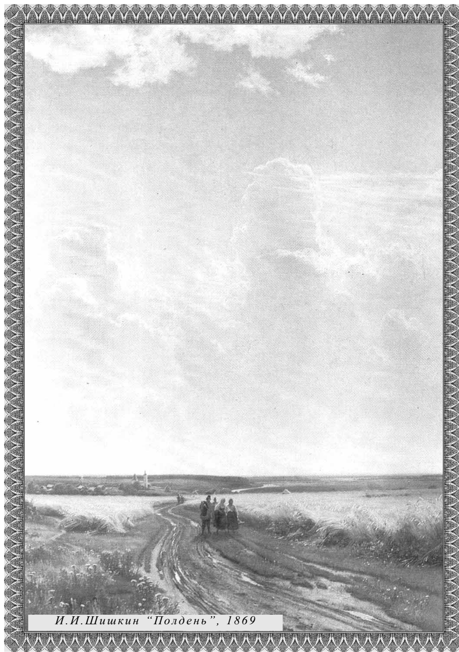
И.И.Шишкин "Полдень", 1869

И когда воспаришь, встретишься с Ним. Он ждет тебя, потому что любит. Он рядом, но ты с Ним не знаком, потому что по земле ходишь. А Он и на землю приходил, за тебя умереть согласился, чтобы ты мог птицей парить в вышине.