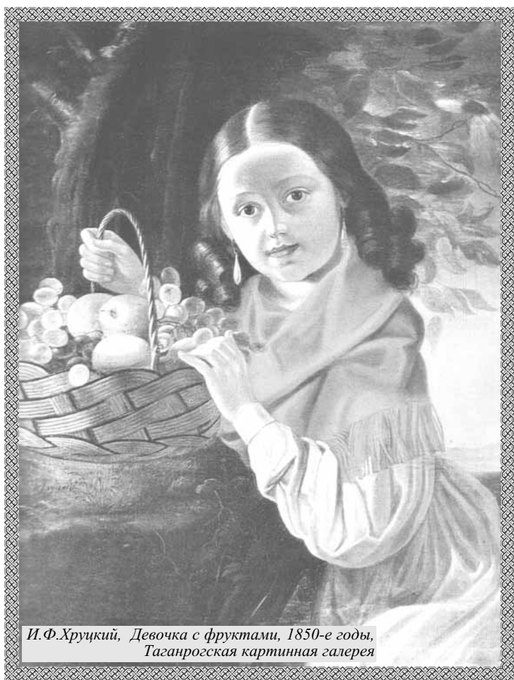
И.Ф.Хруцкий, Девочка с фруктами, 1850-е годы, Таганрогская картинная галерея

Встань перед Ним на колени и ты, принеси Ему покаянное сердце, помолись Ему в тишине! Светлым голубем прилетит Он к тебе, наполнит душу миром и радостью, только поверь Ему!