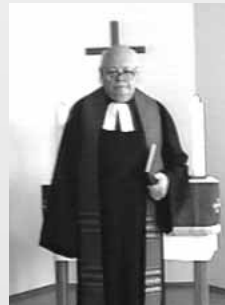
Архиепископ Лютеранской церкви России Георг Кретчмар

Слова поздравления прозвучали от Старшего пастора из города-побратима Билефельда Дитэра Шведфигера, от преподавателя евангелическо-лютеранской семинарии Криса Рэппа, от