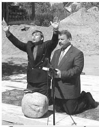
Торжественная молитва о благословении будущего строительства

Благодарность Господу за то, что Он открывает небесные окна для благословения, и мы имеем возможность строить новые Дома молитвы.