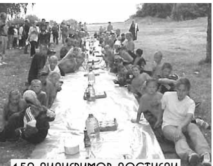
150 ПИЛИГРИМОВ ДОСТИГЛИ НЕБЕСНОГО ИЕРУСАЛИМА

ПОСЛЕ ДОЛГОЙ ДОРОГИ ПИЛИГРИМЫ НУЖДАЮТСЯ В ОТДЫХЕ И ПОДКРЕПЛЕНИИ СИЛ! ОТЛИЧНОЕ ЗАНЯТИЕ - ОБЕД С ДРУЗЬЯМИ НА ПРИРОДЕ. ТЕМ БОЛЕЕ ЧТО ЕДА НАСТОЯЩАЯ, ПОХОДНАЯ: ЗАЖАРЕННАЯ НА КОСТРЕ САРДЕЛЬКА, ОГУРЦЫ И ПОМИДОРЫ, ЙОГУРТЫ И БАНАНЫ. НО САМОЕ ГЛАВНОЕ - ОБЩЕНИЕ С ДРУЗЬЯМИ-ПИЛИГРИМАМИ, ОБМЕН ВПЕЧАТЛЕНИЯМИ.