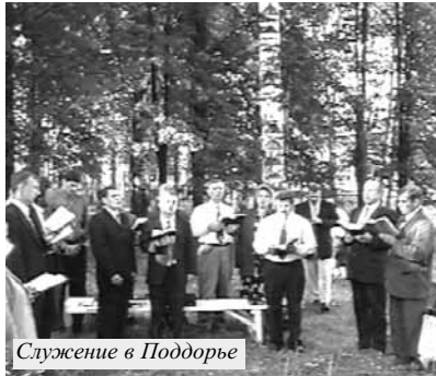
Служение в Поддорье

Дух Господень коснулся сердец местных жителей, пришедших на Богослужение. Несколько из этих людей признали себя грешными перед Богом и обратились к Отцу Небесному в молитве покаяния.