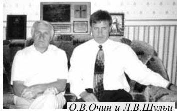
О.В.Очин и Л.В.Шульц

Храм Христа посетил бывший глава исполнительной власти Новгорода, а ныне - член Правительства Москвы, Очин О.В.