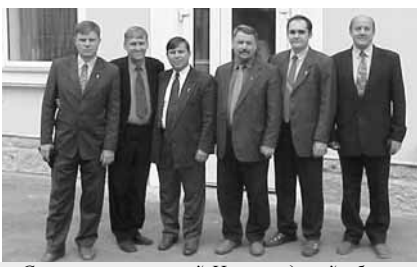
Служители церквей Новгородской обл. и Президент Союза ЕХБ России

В это последнее время, когда людей отделяют друг от друга все больше и больше барьеров, мы имеем прекрасный пример того, как Христос объединяет, казалось бы, разных, но близких по Духу людей, даже если они живут далеко и