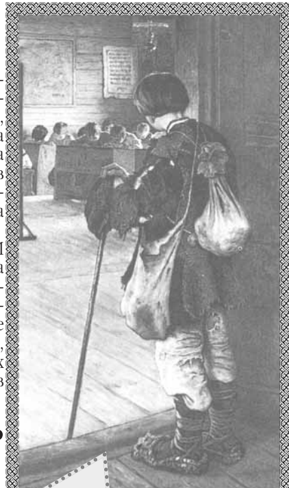
Р.П.Богданов-Бельский "У дверей школы", 1897

После - выпускной, начало взрослой жизни. И никто не думал тогда, что настоящая школа только начинается. Школа жизни. А жизнь прожить - сами знаете - не поле перейти... Жить - это значит бороться, ошибаться, самое трудное - исправлять ошибки, и искать ответы. Ответы, которые кажутся очевидными, но до которых дойти очень тяжело. А впереди всех учеников жизни ждет экзамен Вечности.