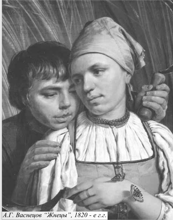
А.Г. Васнецов "Жнецы", 1820 - е.г.г.

Да... пролетело лето незаметно, будто и не было. И пришла осень. Грустновато осенью: теплое летнее солнышко сменили холодные дожди. А поэт сказал: "любое время года надо благодарно принимать". Это он правильно подметил. Осень - со спелыми хлебными нивами, садами, огородами - посвоему хороша. Уборочная страда жаркая: знай, собирай добро да в закрома складывай, чтоб долгой холодной зимой припа-