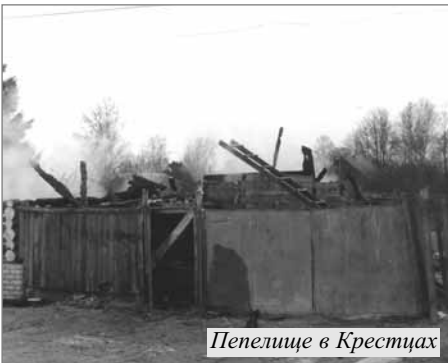
Пепелище в Крестцах

P.S. Недавно в газете «Русский вестник», №3-4, 2002, в статье С.Багрянцева, В.Орлова «Храм» я прочитал о том, что охрана не пустила на Богослужение патриарха Алексея в храм Христа Спасителя. Как известно, главный православный храм не является собственностью церкви, а принадлежит правительству Москвы. Если православные так поступают с главным православным, то что тогда, собственно, ожидать в России инославному?