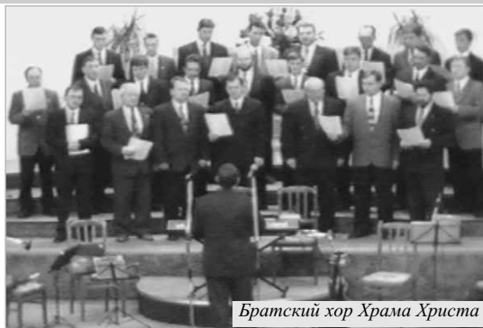
Братский хор Храма Христа

Музыка и живое Слово Божие, которое звучало в Храме, касалось сердец