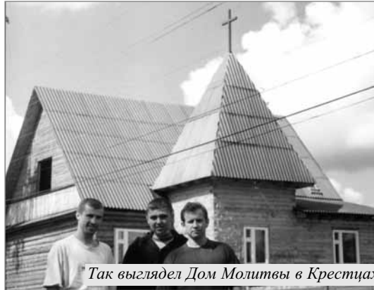
Так выглядел Дом Молитвы в Крестцах

В ночь на 17 ноября , перед воскресным Богослужением около