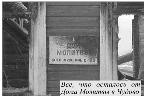
Все, что осталось от Дома Молитвы в Чудово

Итак, прежде всего, прошу совершать молитвы, прошения, моления, благодарения за всех человеков, за царей и за всех начальствующих, дабы проводить нам жизнь тихую и безмятежную во всяком благочестии и чистоте, ибо это хорошо и угодно Спасителю нашему Богу, Который хочет, чтобы все люди спаслись и достигли познания истины. (1Тим.2:1-4)