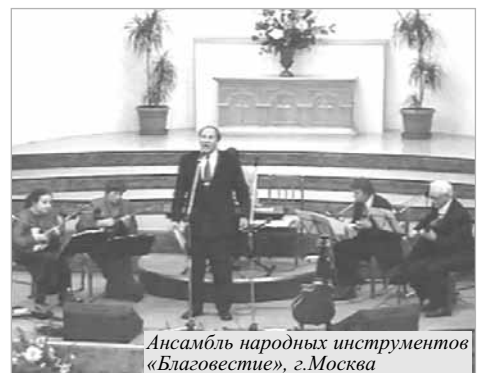
Ансамбль народных инструментов «Благовестие», г.Москва

В эти же дни для братьев-служителей нашей Епархии проходил семинар, на котором рассматривались вопросы о том, каким должен быть священнослужитель и как он должен заботиться о пастве.