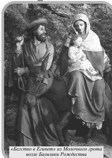
«Бегство в Египет» из Молочного грота возле Базилики Рождества

Почти напротив пещеры находятся три ступеньки, ведущие в капеллу яслей. Сами эти ясли из мрамора; в яслях лежит сделанная из воска