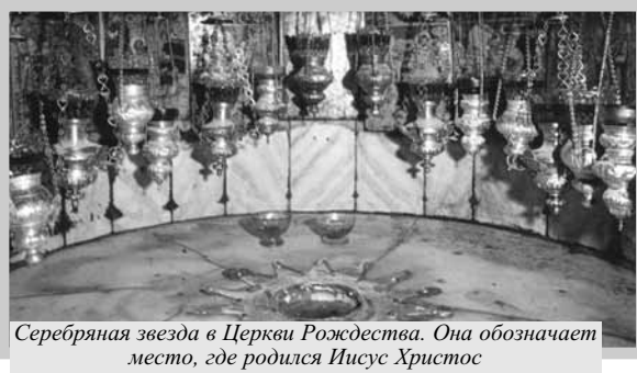
Серебряная звезда в Церкви Рождества. Она обозначает место, где родился Иисус Христос

Эта часть Храма отделена глухой стеной от третьей, в которой и помещается собственно храм над пещерой Рождества Христова. Туда ведут три двери.