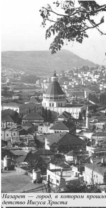
Назарет — город, в котором прошло детство Иисуса Христа