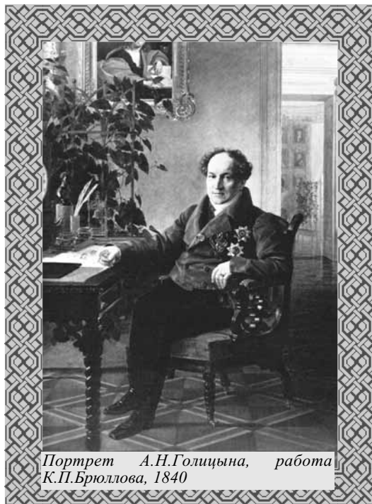
Портрет А.Н.Голицына, работа К.П.Брюллова, 1840

Энциклопедия Брокгауза, 1876 год, том 6, стр. 696—697