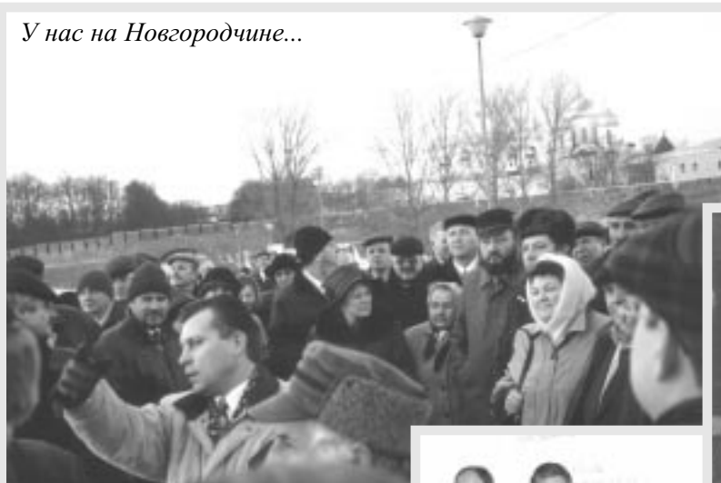
У нас на Новгородчине...