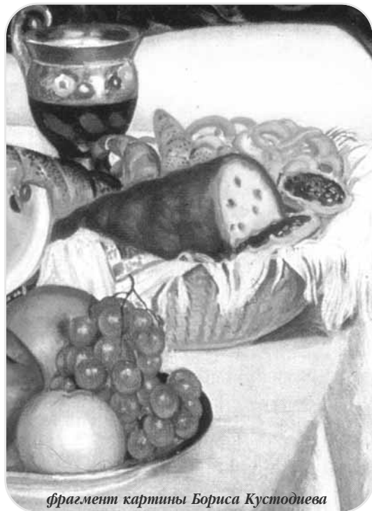
фрагмент картины Бориса Кустодиева

Итак не заботьтесь и не говорите: что нам есть? или что пить? или во что одеться? потому что всего этого ищут язычники, и потому что Отец ваш Небесный знает, что вы имеете нужду во всем этом. Ищите же прежде Царства Божия и правды Его, и это все приложится вам. (От Матфея 6 глава)