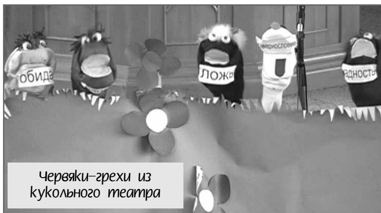
Червяки-грехи из кукольного театра