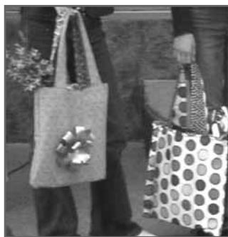
Сумки, сделанные своими руками