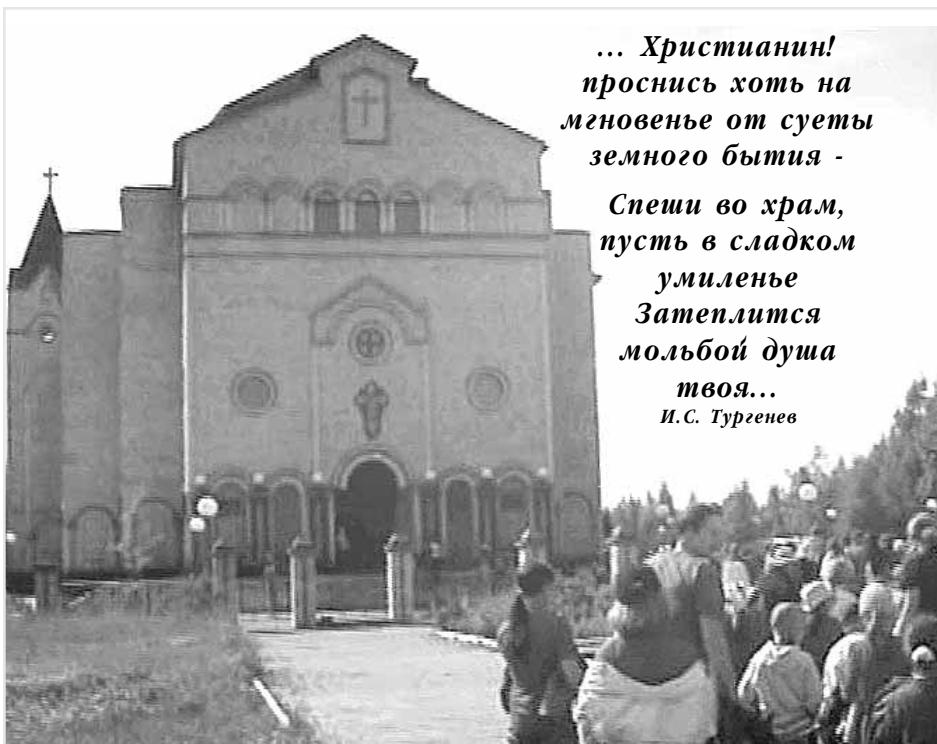
ул. Кочетова – 24

Храм открыт для Вас каждый день с 9 00 до 19 00 . Вы можете побеседовать со священником, побывать на Богослужениях каждую среду в 19 00 и каждое воскресенье в 10 00 и в 17 00 . По воскресеньям в 14 00 – просмотр видеофильмов, в 15 00 проходит Библейский час, на котором можно задать служителю интересующие Вас вопросы и получить в подарок Библию.