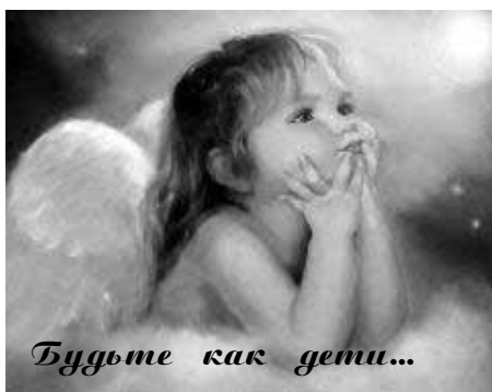
Будьте как дети...