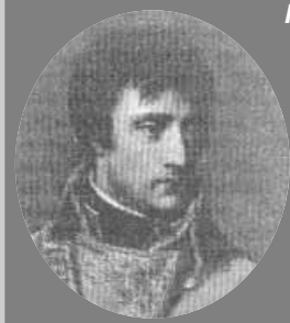
Наполеон, французский император

Душа, восторгающаяся красотой Евангелия, не принадлежит больше себе, Бог владеет ею всецело, Он направляет ее мысли и способности, она принадлежит Ему.