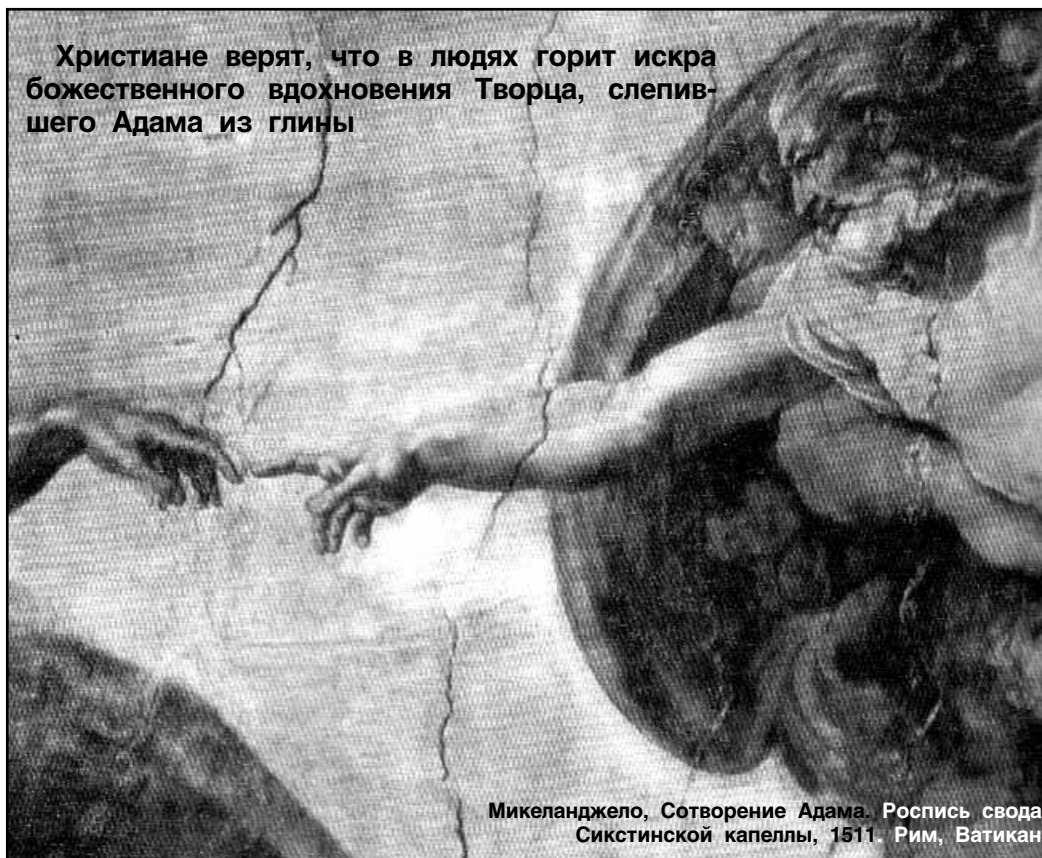
Микеланджело. Сотворение Адама. Роспись свода Сикстинской капеллы, 1511. Рим, Ватикан

Христиане верят, что в людях горит искра божественного вдохновения Творца, слепившего Адама из глины