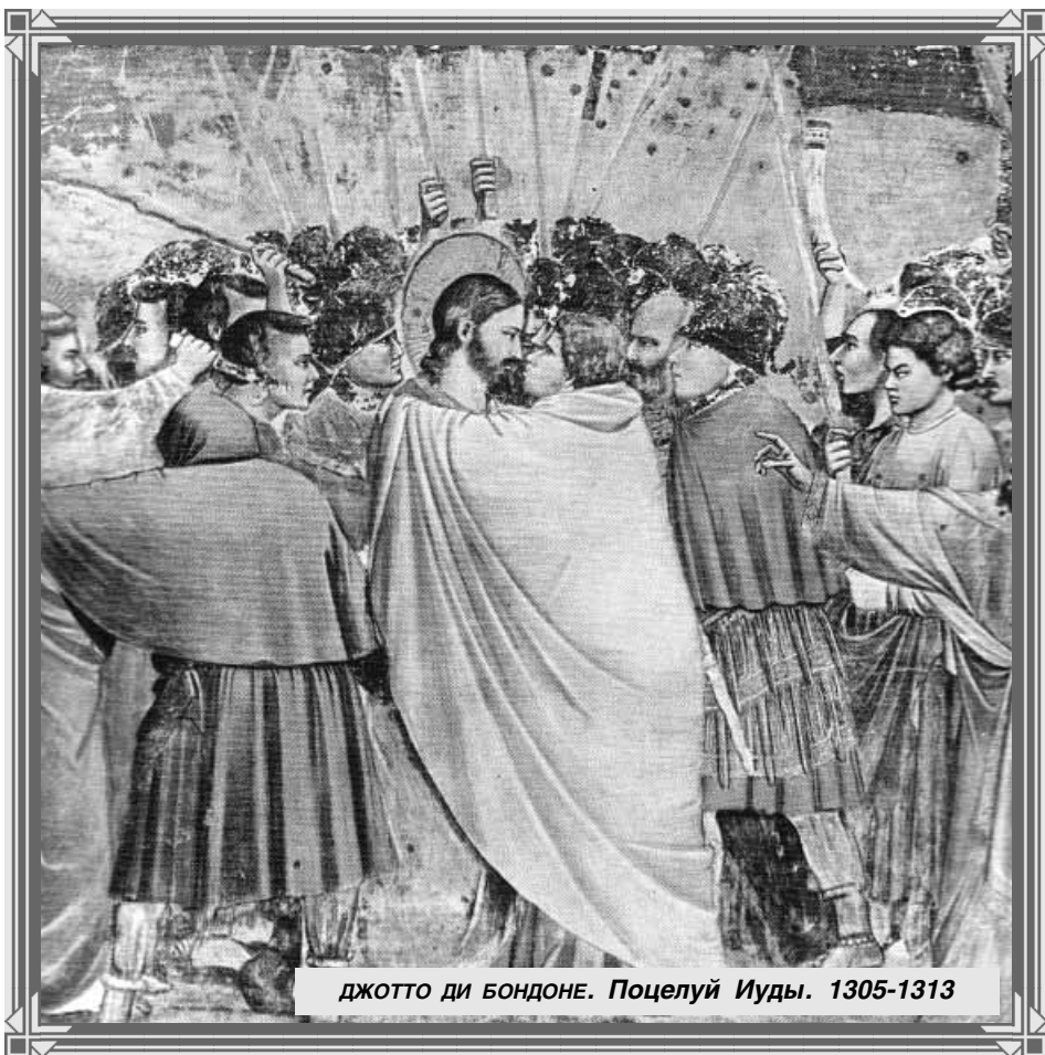
ДЖОТТО ДИ БОНДОНЕ. Поцелуй Иуды. 1305-1313

А что еще вы хотели от человека, заключившего завет с дьяволом? Несколько часов назад он переступил грань, предав дружбу, любовь, доверие, честь, совесть, переступив чело-