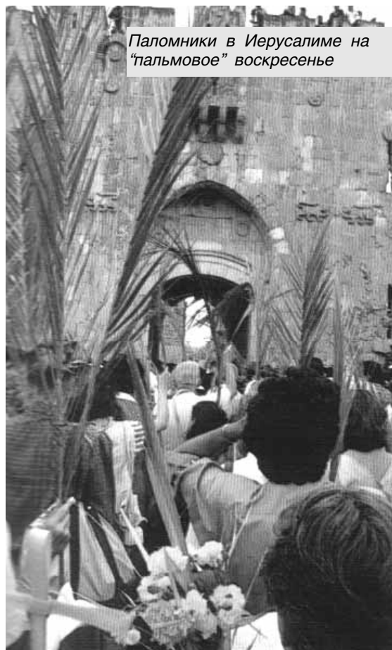
Паломники в Иерусалиме на "пальмовое" воскресенье