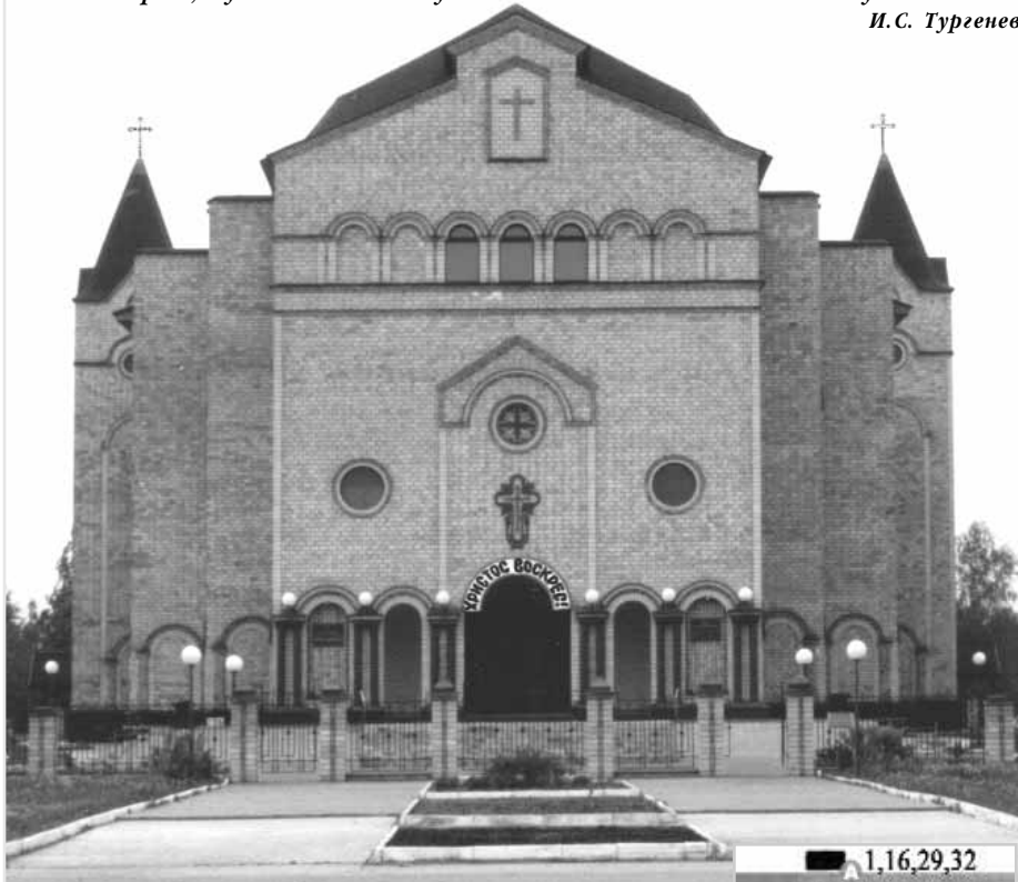
ул. Кочетова – 24

... Христианин! проснись хоть на мгновение от суеты земного бытия - Спеши во храм, пусть в сладком умиленье Затеплится мольбой душа твоя... И.С. Тургенев