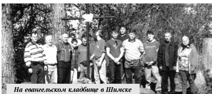
На евангельском кладбище в Шимске