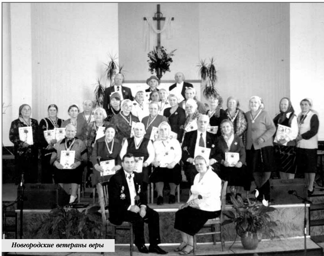
Новгородские ветераны веры

Если вы нуждаетесь в жизненном совете, духовной консультации или просто в общении — душепопечитель в Храме Христа поможет вам!