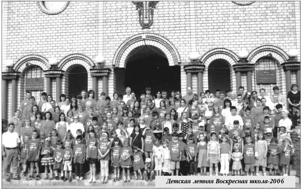
Детская летняя Воскресная школа-2006