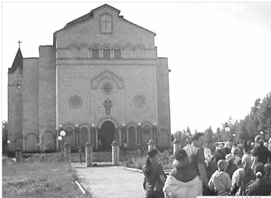
ул. Кочетова – 24

Храм открыт для Вас каждый день с 9 00 до 19 00 . Вы можете побеседовать со священником, побывать на Богослужениях каждую среду в 19 00 и каждое воскресенье в 10 00 и в 17 00 . По воскресеньям в 14 00 – просмотр видеофильмов, в 15 00 проходит Библейский час, на котором можно задать служителю интересующие Вас вопросы и получить в подарок Библию.