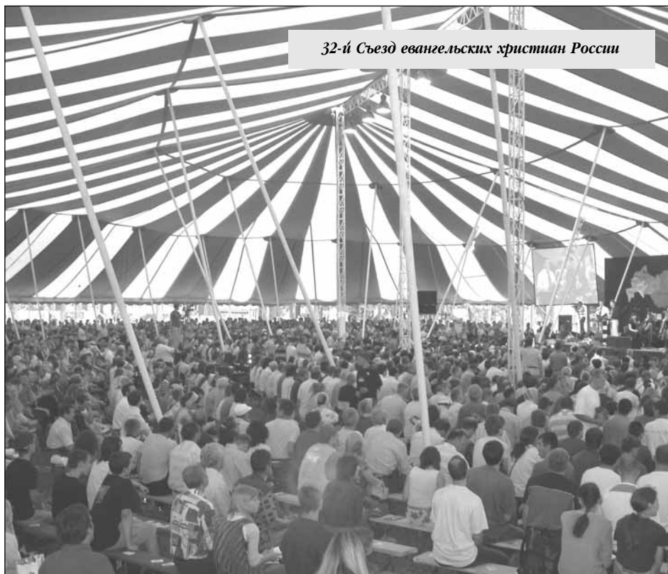
32-й Съезд евангельских христиан России

Впервые надпись "In God We Trust", что в переводе на русский язык означает "Мы верим в Бога", появилась на американских монетах в 1864 году. Почти столетие спустя, 30 июля 1956 года, Конгресс США постановил считать эти слова национальным девизом. В настоящее время существует закон, по которому использование национального девиза "Мы верим в Бога" является обязательным на всех денежных знаках США — монетах и бумажных купюрах. Использование данного девиза неоднократно оспаривалось в различных судах, но все суды выносили решение в пользу девиза.