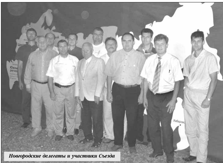
Новгородские делегаты и участники Съезда