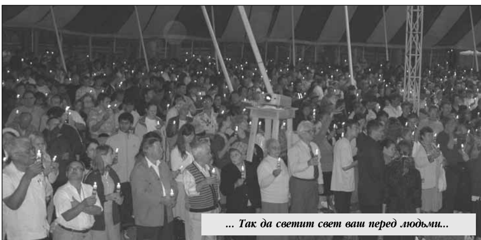
... Так да светит свет ваш перед людьми...