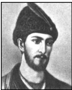
Шота Руставели, портрет работы А.Райншивили, 1875