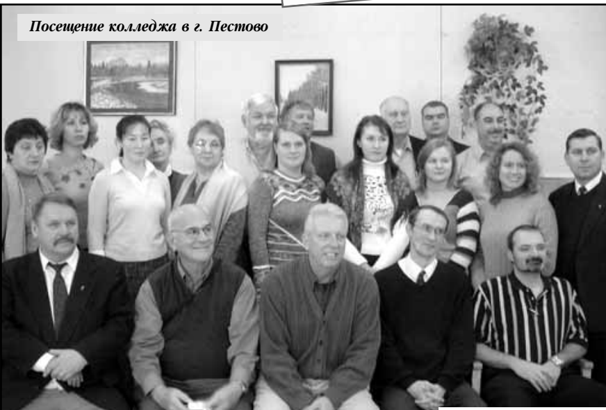
Посещение колледжа в г. Пестово