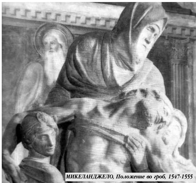
МИКЕЛАНДЖЕЛО, Положение во гроб, 1547-1555

Можно ли казненному, умирающему человеку при-