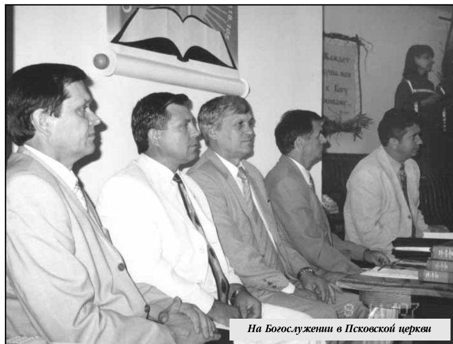
На Богослужении в Псковской церкви

В этот же день 120-летний юбилей отмечала церковь города Боровичи Новгородской области. Евангельская история на новгородчине — мой особый интерес. Работа в архиве похожа на работу на золотом прииске, каждая находка как золотой самородок. Одна из них — выписка из рапорта пристава Боровичского уездного полицейского управления от 29 октября 1887 года за „ 2084: «В де-