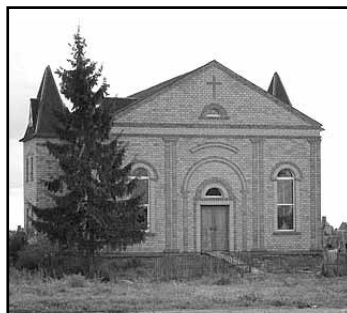
Участники благовествования в д. Чечулино, в новом Храме

проходила евангелизация с участием молодежи из Библейской школы церкви г. Санкт-Петербурга и молодежи из церкви Храм Христа г. Великого Новгорода. Братья и сестры проповедовали с утра до поздней ночи, рассказывая всем желающим о Христе.