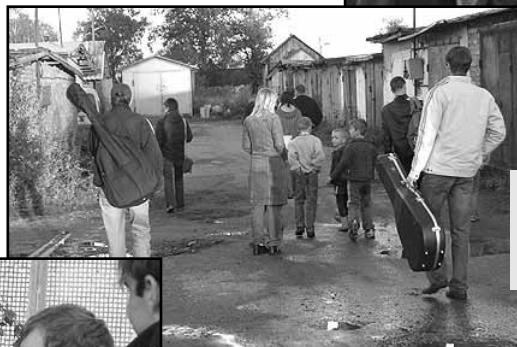
Встречи на дороге благовестия