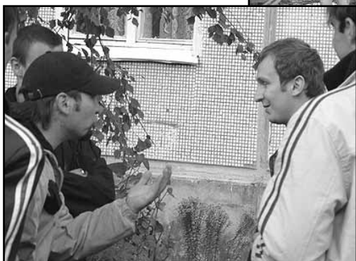
Скажи кому-нибудь сегодня о Христе...