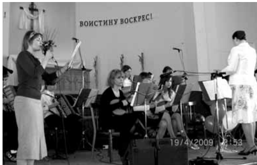
Оркестр Храма Христа

После обеда христиане вышли на улицу для благовестия. У жителей города есть традиция на Вербное воскресенье, Пасху и Троицу посещать "Западное клад-