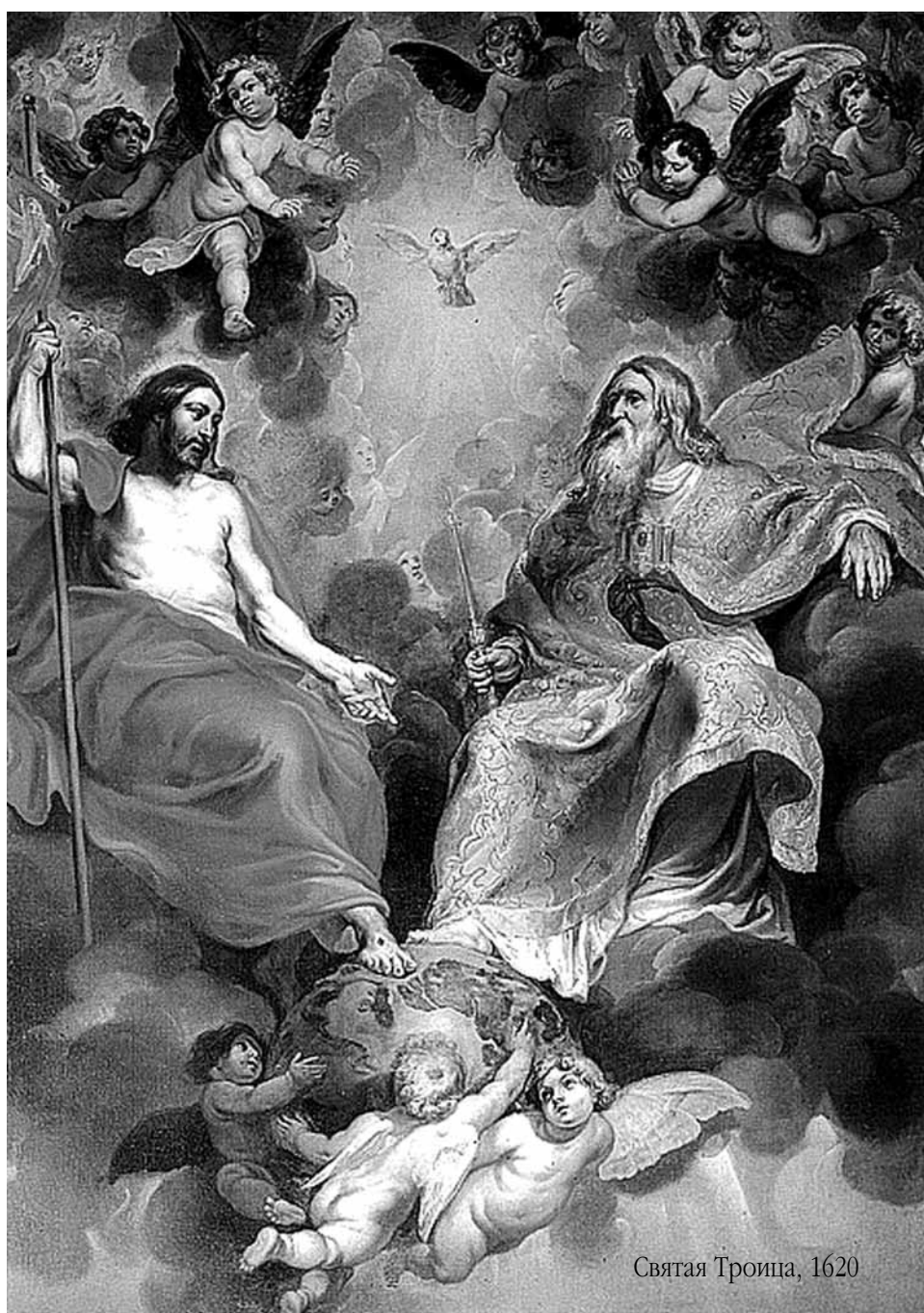
Святая Троица, 1620