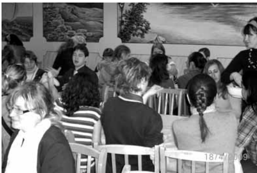
Общение глухих после Пасхального Богослужения

участие хор Храма Христа, вокальная и инструментальная группы прославления, детский хор и оркестр народных инструментов. Красоту их выступлений усиливало разнообразие звучащей музыки: здесь были еврейские и русские, современные и традиционные песни.