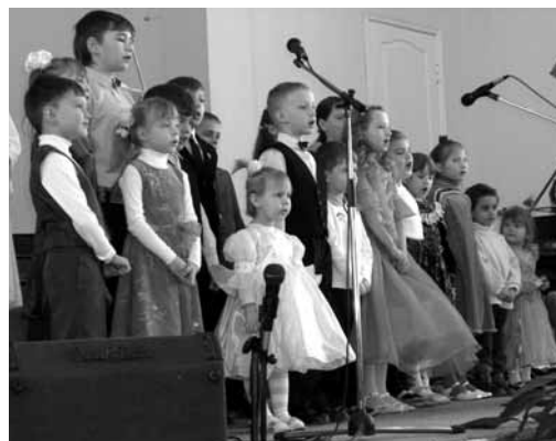
Детский хор Храма Христа