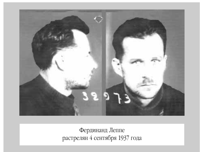
Фердинанд Леппе растрелян 4 сентября 1937 года