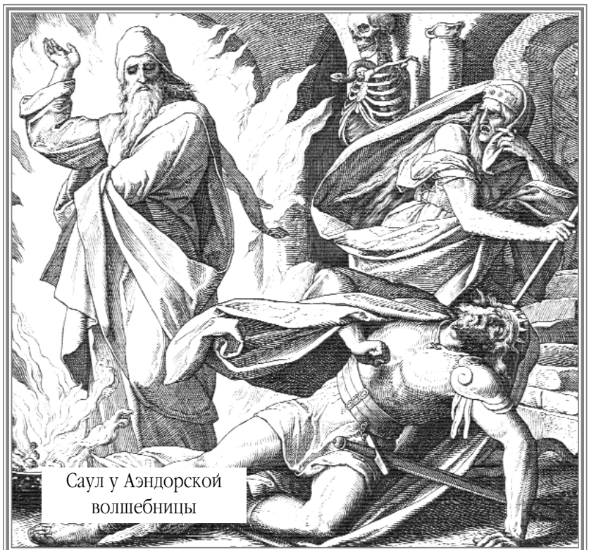
Саул у Аэндорской волшебницы