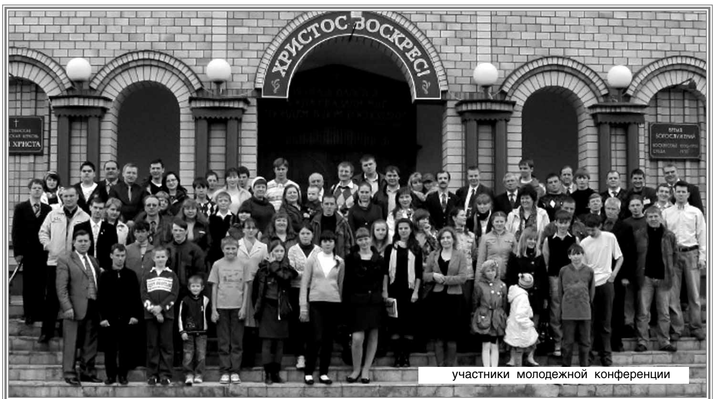
участники молодежной конференции