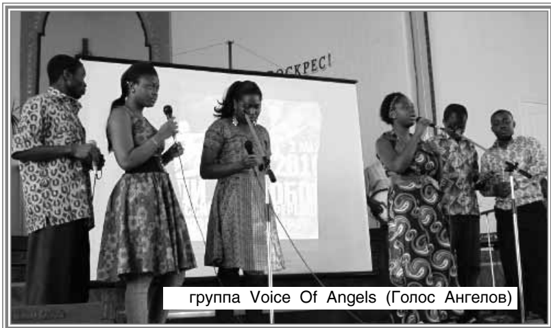
группа Voice Of Angels (Голос Ангелов)

В программе конференции участвовали: основной хор и молодежный хор Храма Христа, группа прославления, 2 африканские группы Voice Of Angels (Голос Ангелов) и Light of Hope