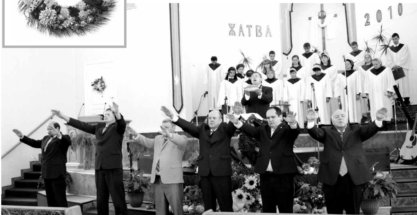
Праздник Жатвы (Молитва благодарения)