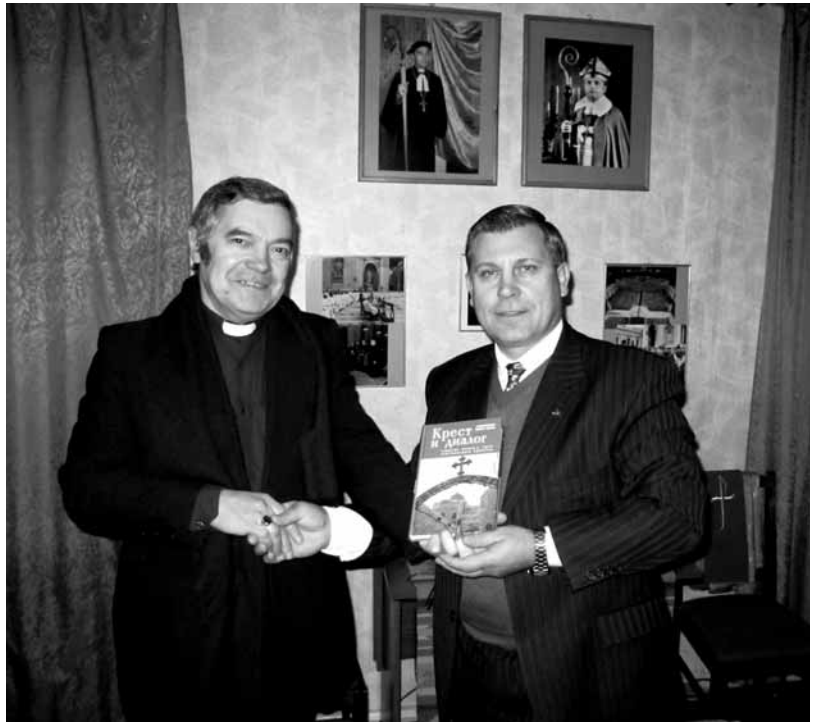
Архиепископ Иосиф Барон и Епископ А.И. Корабель

8 октября В связи с выходом книги «Крест и диалог» Архиепископ Иосиф Барон любезно принял у себя делегацию пасторов, возглавляемую Епископом Новгородского Объединения А.И. Корабель.