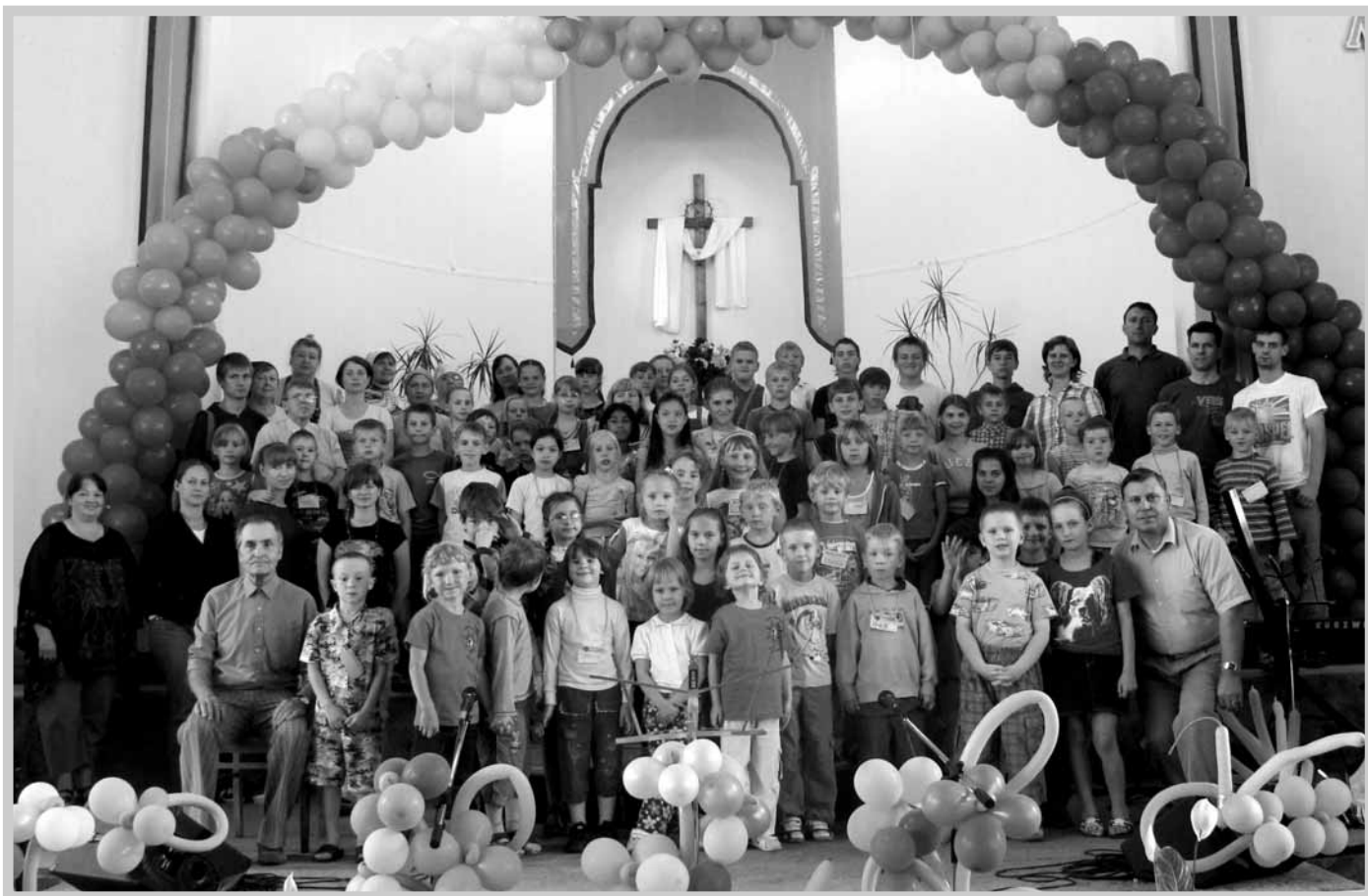
Заккрытие Воскресной школы на каникулах