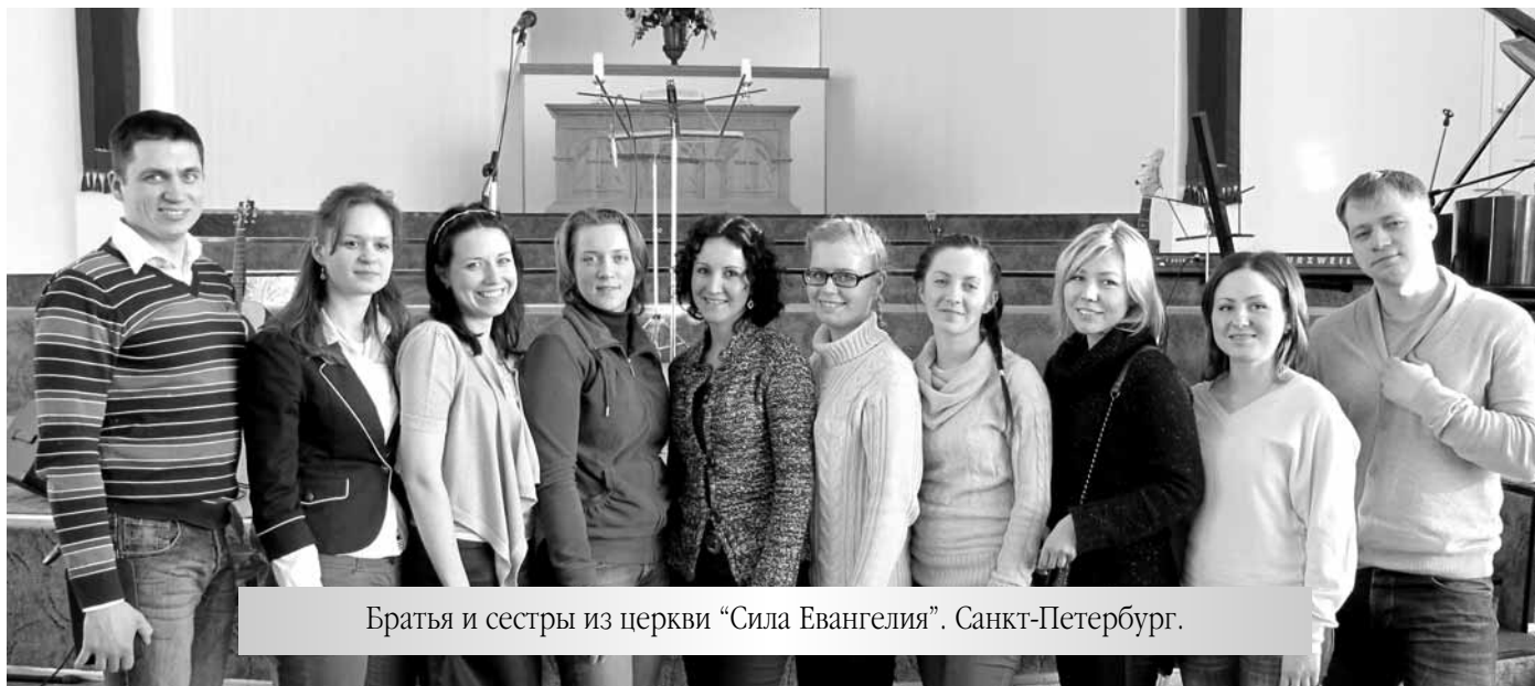
Братья и сестры из церкви «Сила Евангелия». Санкт-Петербург.