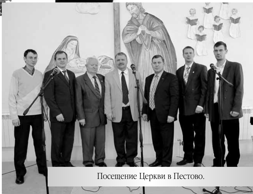
Посещение Церкви в Пестово.

Каким бы сладостным не было наше общение, мы сфотографировались на память и попросили пастора благословить нас на служение в г. Боровичах.