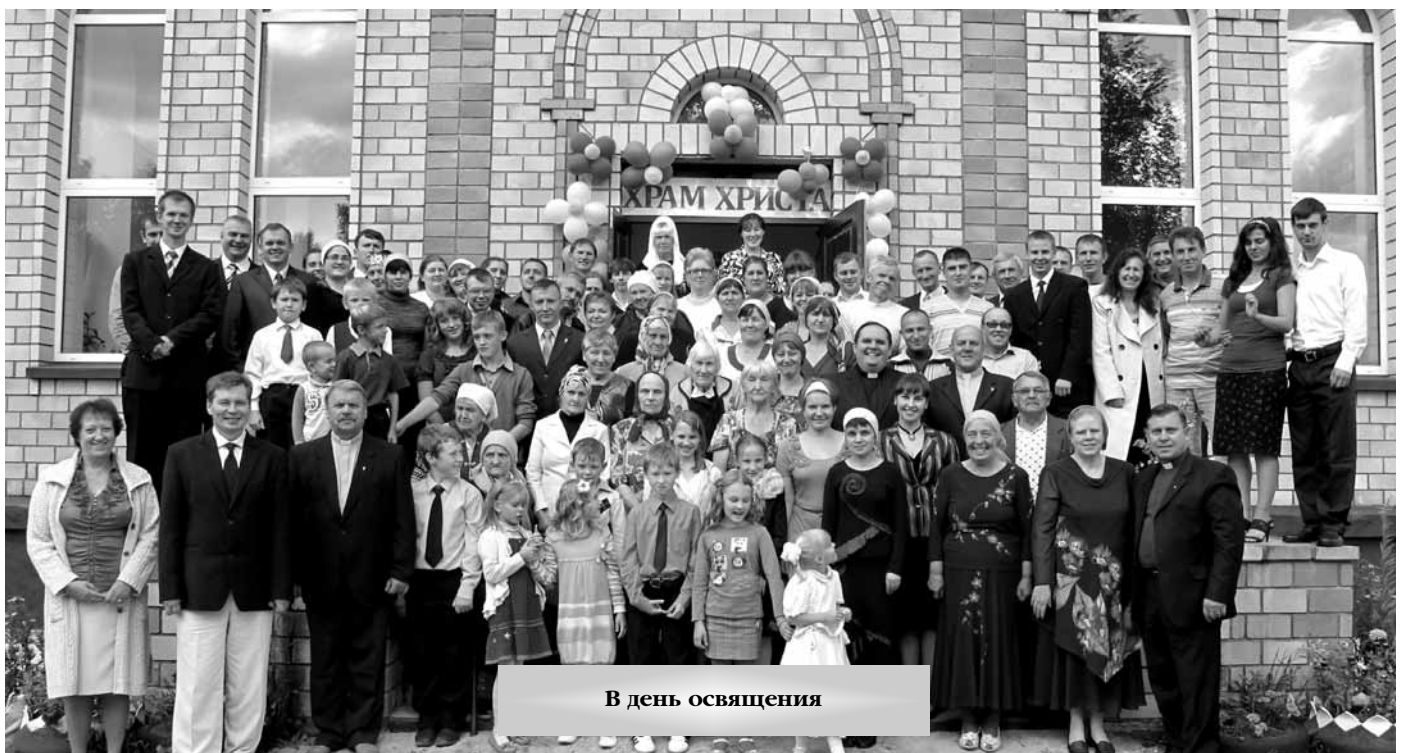
В день освящения

Сегодня мы, все вместе, присоединяясь к Давиду можем сказать: «Так, благость и милость Твоя