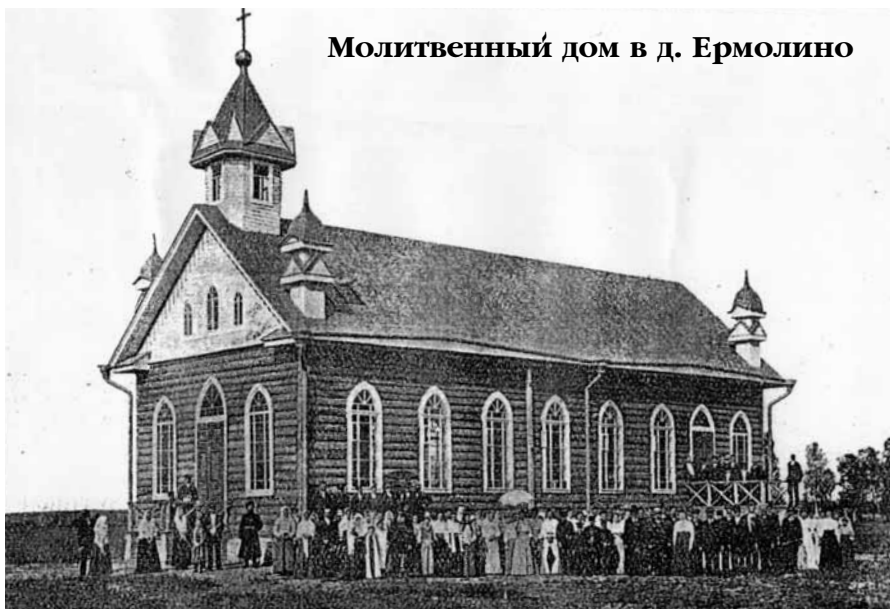
Молитвенный дом в д. Ермолино

29 мая 1914 года образовалось, и было зарегистрировано первое Новгородское Объединение –