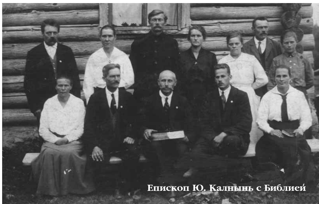
Епископ Ю. Калнынь с Библией