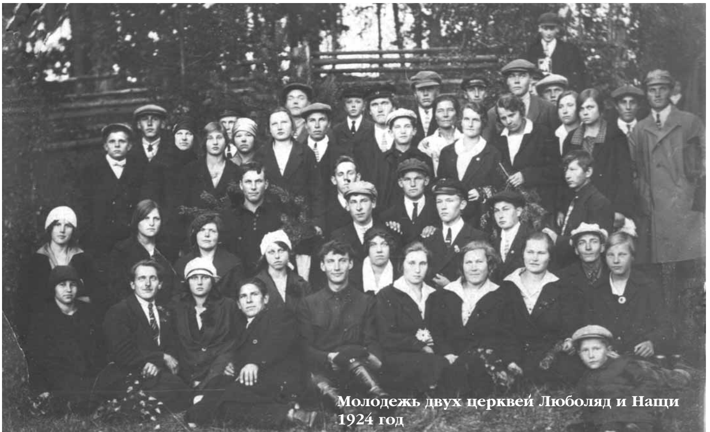
Молодежь двух церквей Люболяд и Наци 1924 год