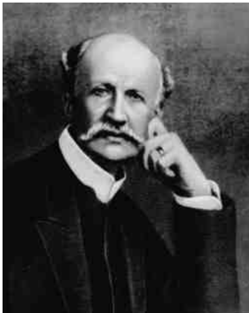
Граф М. М. Корф (1842–1933)

Покорнейшая просьба удерживать непременно от прибытия сюда таких, которые не от церкви присылаются».