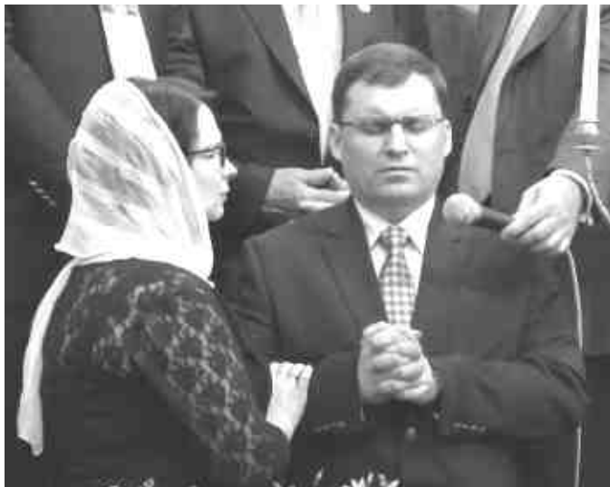
Благословение четы Сипко

Далее Залутский добавил к выступлению свои слова: «Пусть Господь благословит вас, братья и сестры! И пусть умножит Свою благодать на вас. Мне очень нравится и импонирует моему сердцу тема вашего Съезда: «Церковь, рожденная Духом Святым». Пусть Господь благословит вас дойти до