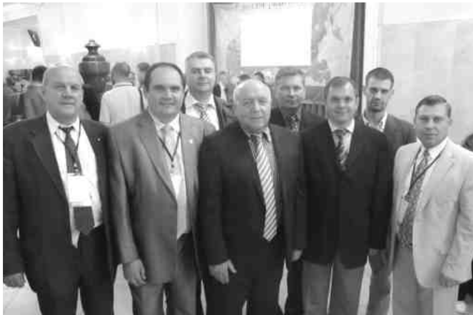
Делегация Новгородского объединения

«Русская православная церковь всегда готова вести христианский диалог. Тысячелетняя традиция православной церкви в России приветствует сегодня в моем лице молодую вашу 130 летнюю традицию евангельских христиан-баптистов. Я сердечно поздравляю всех вас с наступающим завтра великим праздником Вознесения Господня. Именно вознесение христово дает каждому христианину радость надежду. Если мы принадлежим телу Христову и Его святой церкви, то и наше пребывание на земле в ожидании пришествия Христова во славе Его для окончательного суда миру сему становится исполненным смыслом. Наша жизнь протекает по слову святого апостола Иоанна. В последние времена, которые начались от вознесения и до второго пришествия