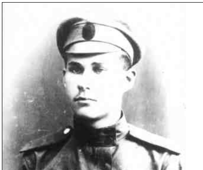
Леппе Фердинандт (расстрелян в 1938 г.)