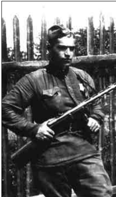
Во время войны

Первый раз я услышал о войне 22 июня, я в то время работал на шахте в Кемерово. Утром, когда началась война, мне нужно было выйти на работу в первую смену. Прихожу на шахту и вижу много собравшихся и беспокойных людей. Когда я спросил, что случилось, то услышал в ответ: «Война!»