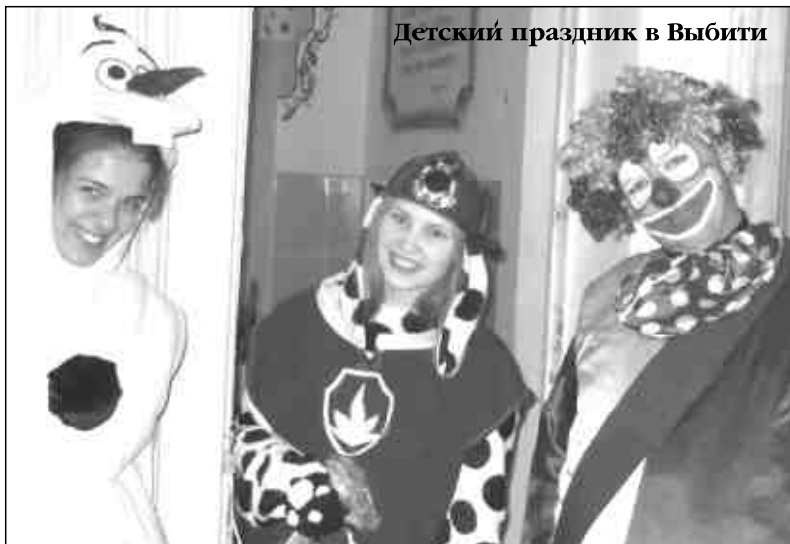
Детский праздник в Выбити