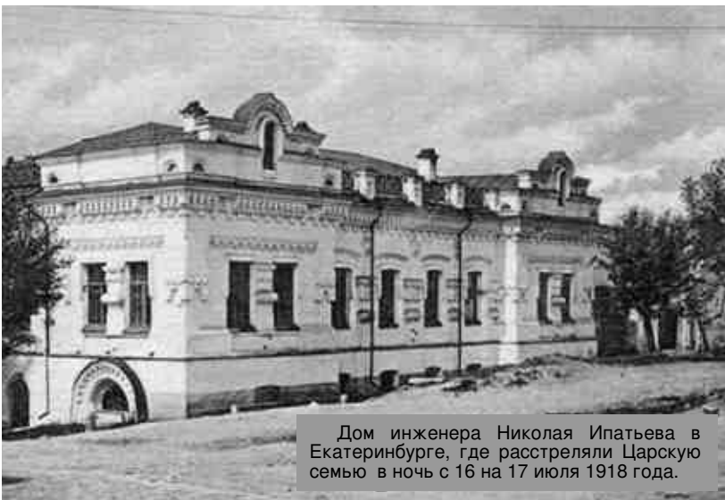
Дом инженера Николая Ипатьева в Екатеринбурге, где расстреляли Царскую семью в ночь с 16 на 17 июля 1918 года.

Приведем оба. Автора этих строк больше взволновало стихотворение самой Ольги.