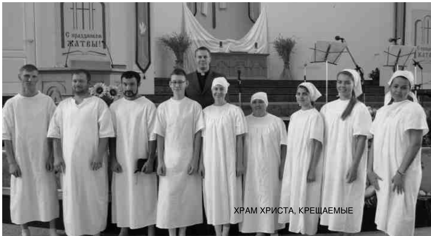
ХРАМ ХРИСТА, КРЕЩАЕМЫЕ