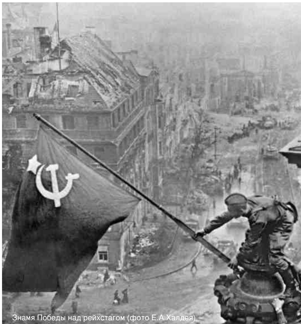
Знамя Победы над рейхстагом

75 ПОБЕДА! 1945-2020 1945 2020 Поздравляем с праздником Великой Победы!